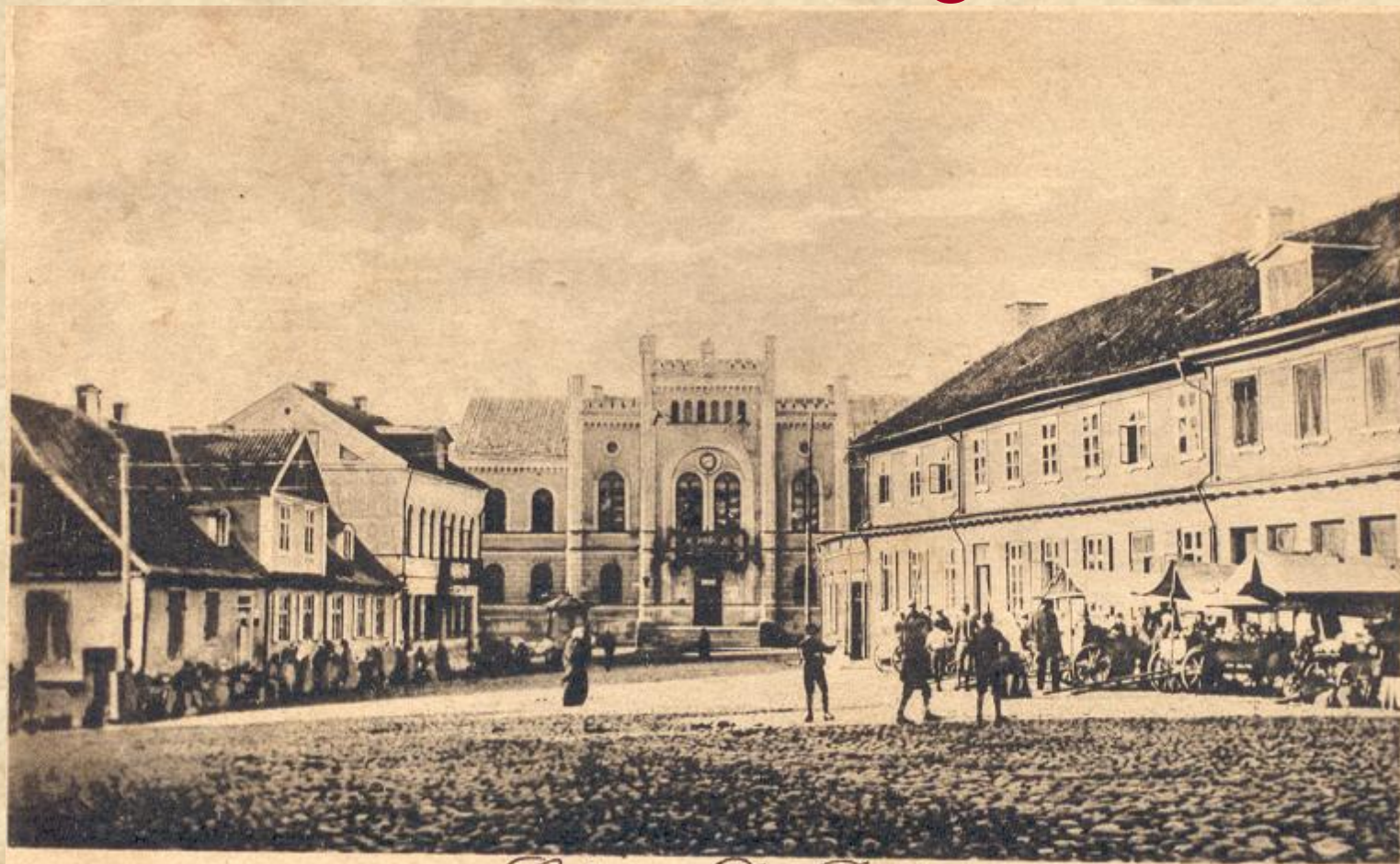
Goldingen, Das Rathaus